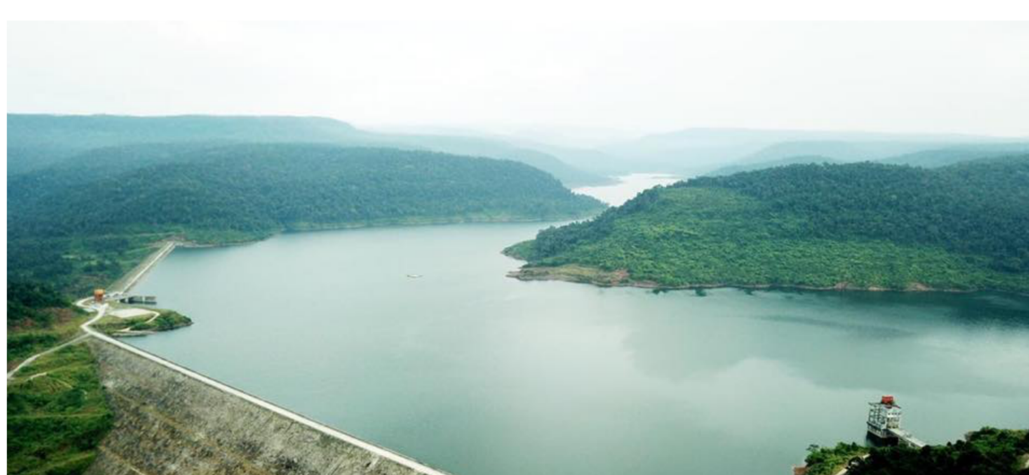
២០ រឿង ២០១៩ - 5.8K Views

ឯកឧត្តមរដ្ឋមន្ត្រីប្រតិភូអមនាយករដ្ឋមន្ត្រី អគ្គនាយកអគ្គិសនីកម្ពុជា បានអនុញ្ញាតឲ្យនិស្សិតជ័យលាភី អាហារូបករណ៍អភិវឌ្ឍន៍ធានាមនុស្សរបស់ប្រទេសជប៉ុនដែលត្រូវសិក្សាបរិញ្ញាបត្រជាន់ខ្ពស់ ចូលសិក្សា ស្វែងយល់អំពីការអភិវឌ្ឍវិស័យអគ្គិសនី។