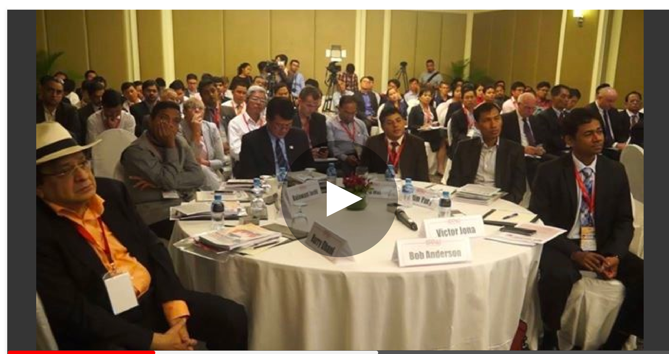
February 24, 2016 - 23.8K Views លំអិត >

ថាមពលពន្លឺព្រះអាទិត្យឆ្ពោះទៅការអភិវឌ្ឍន៍ដោយ ចីរភាព