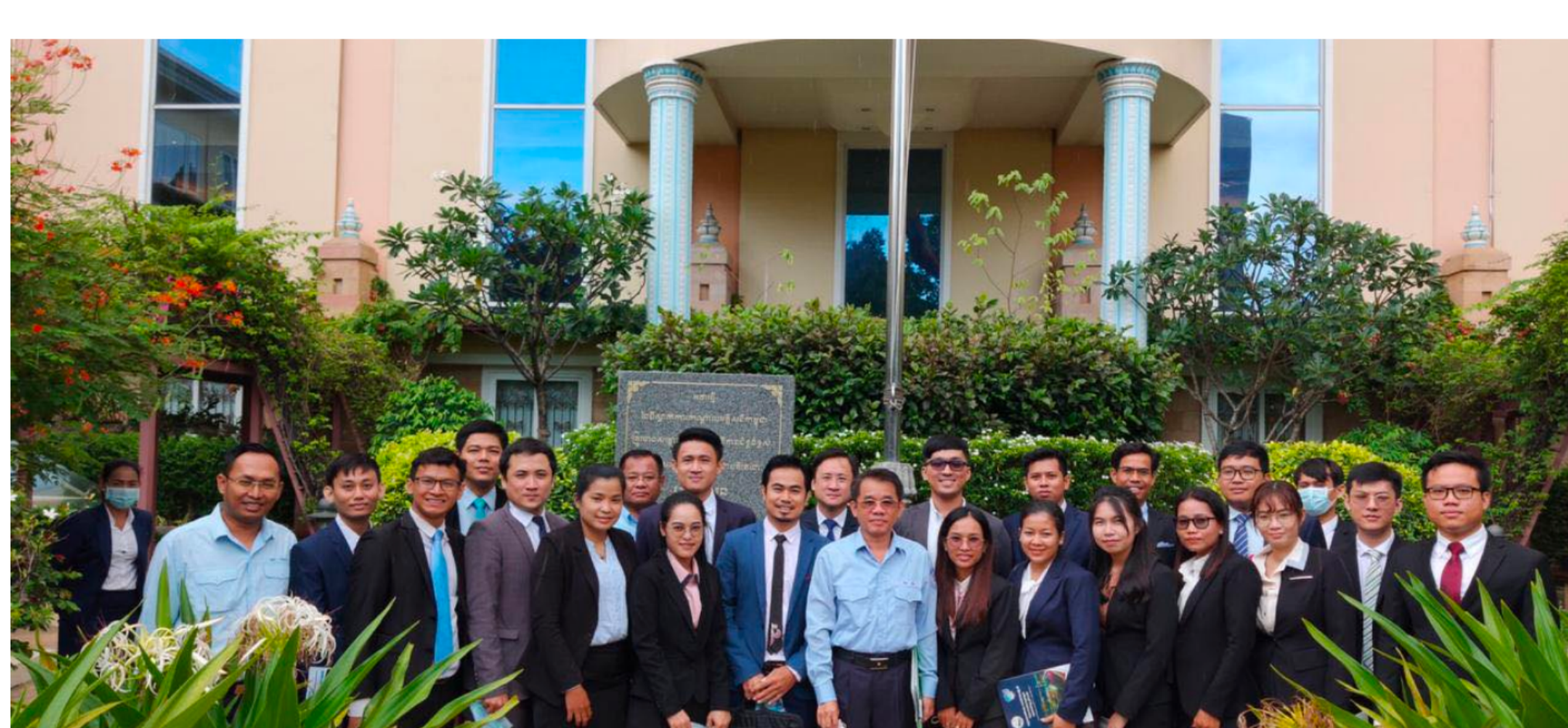
២០ រឿង ២០១៩ - 5.8K Views

ឯកឧត្តមរដ្ឋមន្ត្រីប្រតិភូអមនាយករដ្ឋមន្ត្រី អគ្គនាយកអគ្គិសនីកម្ពុជា បានអនុញ្ញាតឲ្យនិស្សិតជ័យលាភី អាហារូបករណ៍អភិវឌ្ឍន៍ធានាមនុស្សរបស់ប្រទេសជប៉ុនដែលត្រូវសិក្សាបរិញ្ញាបត្រជាន់ខ្ពស់ ចូលសិក្សា ស្វែងយល់អំពីការអភិវឌ្ឍវិស័យអគ្គិសនី។