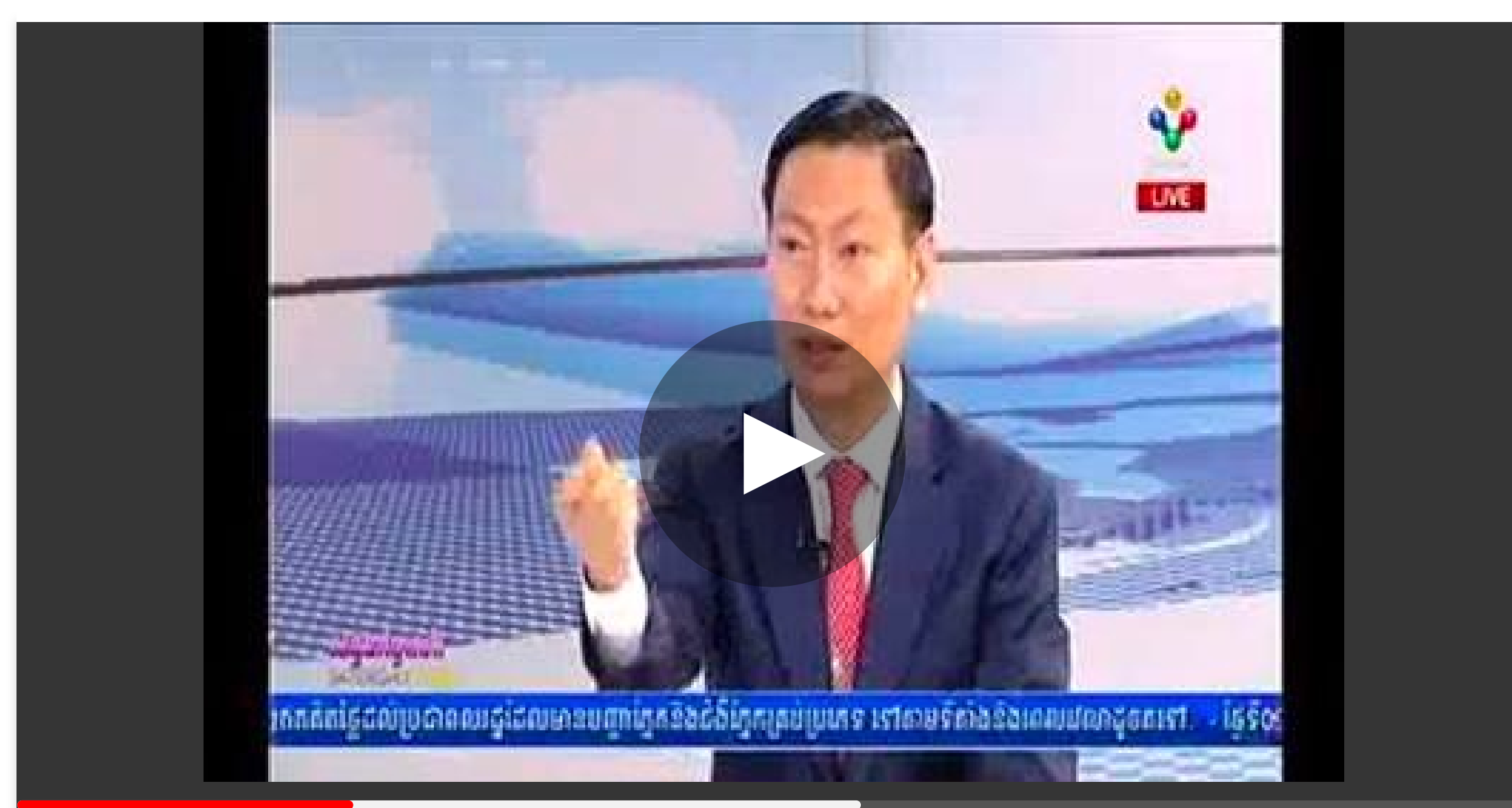
January 19, 2016 - 6.7K Views លំអិត >