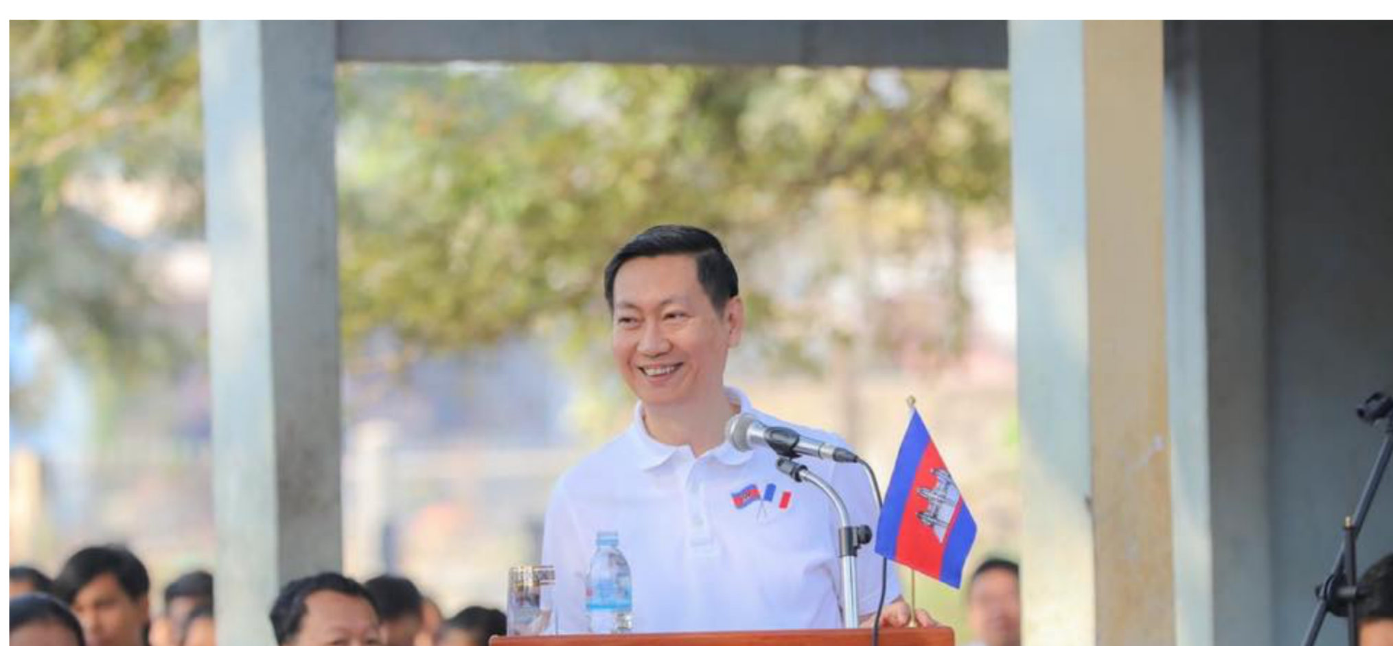
២០ រឿង ២០១៩ - 5.8K Views

ឯកឧត្តមរដ្ឋមន្ត្រីប្រតិភូអមនាយករដ្ឋមន្ត្រី អគ្គនាយកអគ្គិសនីកម្ពុជា បានអនុញ្ញាតឲ្យនិស្សិតជ័យលាភី អាហារូបករណ៍អភិវឌ្ឍន៍ធានាមនុស្សរបស់ប្រទេសជប៉ុនដែលត្រូវសិក្សាបរិញ្ញាបត្រជាន់ខ្ពស់ ចូលសិក្សា ស្វែងយល់អំពីការអភិវឌ្ឍវិស័យអគ្គិសនី។