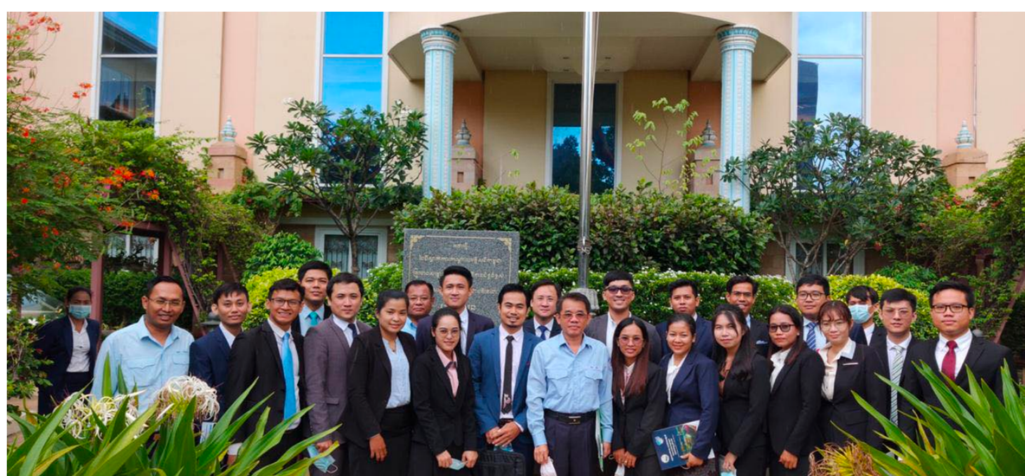
២០ រឿង ២០១៩ - 5.8K Views

ឯកឧត្តមរដ្ឋមន្ត្រីប្រតិភូអមនាយករដ្ឋមន្ត្រី អគ្គនាយកអគ្គិសនីកម្ពុជា បានអនុញ្ញាតឲ្យនិស្សិតជ័យលាភី អាហារូបករណ៍អភិវឌ្ឍន៍ធានាមនុស្សរបស់ប្រទេសជប៉ុនដែលត្រូវសិក្សាបរិញ្ញាបត្រជាន់ខ្ពស់ ចូលសិក្សា ស្វែងយល់អំពីការអភិវឌ្ឍវិស័យអគ្គិសនី។