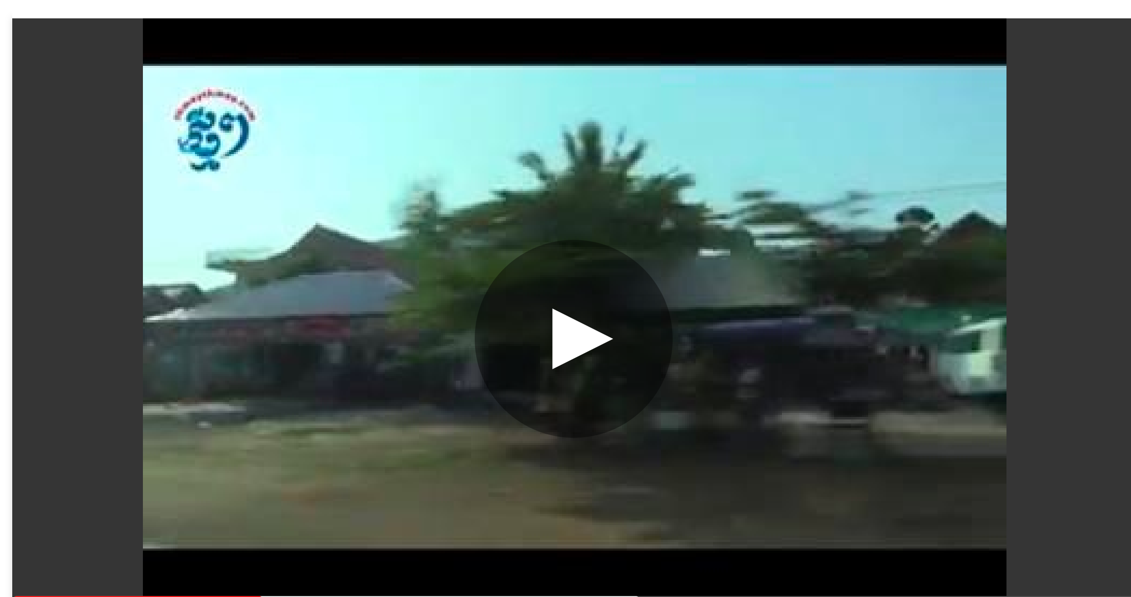
January 19, 2016 - 5.8K Views លំអិត >

ការប្រែប្រួលចំនុចវិជ្ជមានថ្មី នៃអគ្គិសនីកម្ពុជា