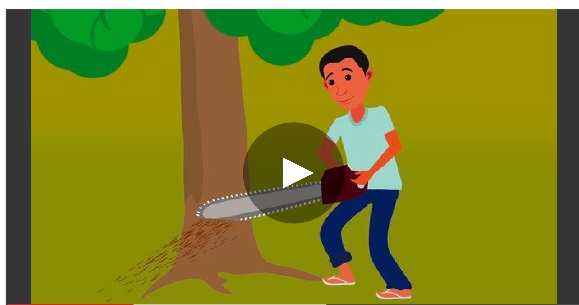
August 29, 2019 - 51K Views លំអិត >

វិធានការ និងការទប់ស្កាត់លើប្រព័ន្ធខ្សែបណ្តាញ បញ្ជូនអគ្គិសនី។